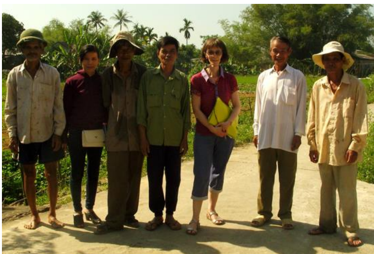
Mission d'avril 2017 – Micro-crédits pour le maraîchage bio