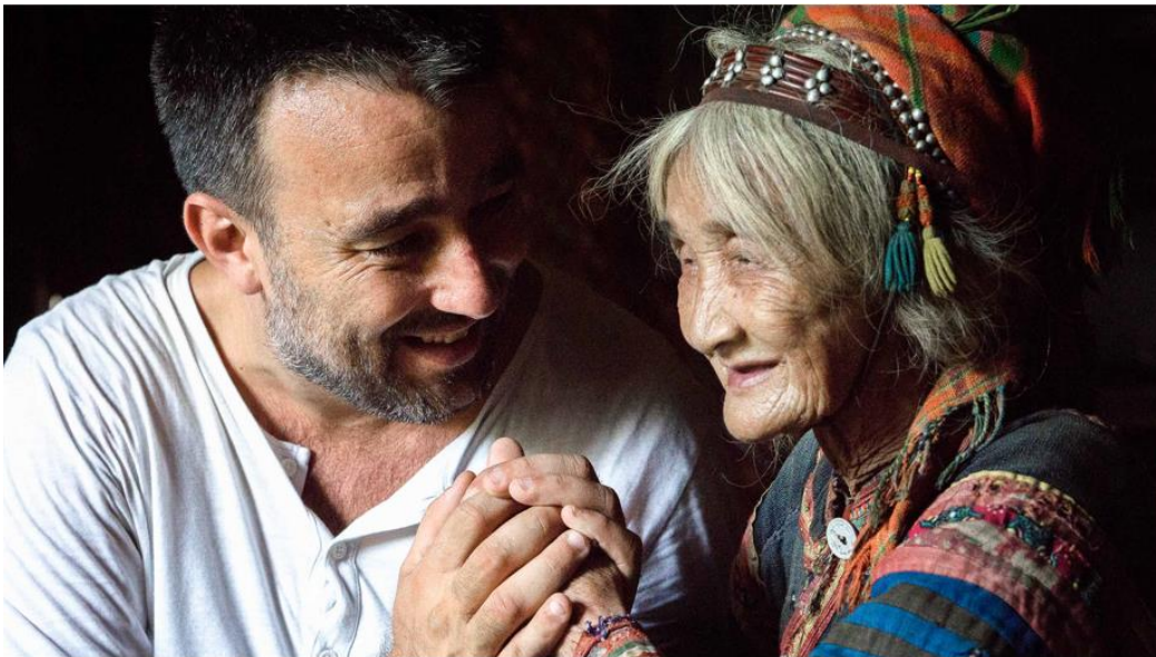
Rehahn- Croquevielle - Photographe

Situé dans une maison traditionnelle, le musée rappelle que le Vietnam est une mosaïque de peuples et de traditions dont la richesse mérite d'être connue et préservée. Au fil des salles, vous découvrirez les magnifiques photographies de Réhahn, capturant les sourires, les visages et le quotidien des communautés rencontrées, ainsi qu'une collection unique de costumes authentiques. Chaque tenue raconte une histoire, révèle des savoir-faire ancestraux et témoigne de l'identité propre à chaque groupe ethnique. Des vidéos immersives complètent la visite et vous plongent dans la vie quotidienne des régions les plus reculées du Vietnam.